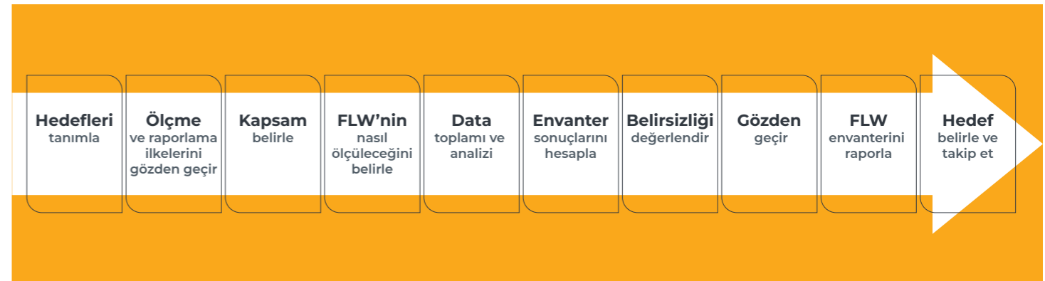
Şekil 4. FLW Standardı Temel Adımları

Gıda kaybı ve israfını azaltmanın sadece ulusal değil uluslararası da bir konu olduğunun farkında olan Türkiye, Tarım ve Orman Bakanlığının koordinasyonunda ve Birleşmiş Milletler Gıda ve Tarım Örgütü (FAO) işbirliğinde, gıda kaybı ve israfının azaltılmasına yönelik olarak "GIDANI KORU-Sofrana Sahip Çık" isimli büyük çaplı, uluslararası ayağı da olan bir kampanyayı 20 Mayıs 2020 tarihinde başlatmıştır. Kampanya kapsamında, gıda zincirindeki tüm aktörlerin yer aldığı, çok paydaşlı ve geniş bir istişare süreci sonucunda hazırlanan "Türkiye'nin Gıda Kayıpları ve İsrafının Önlenmesi, Azaltılması ve Yönetimine İlişkin Ulusal Strateji Belgesi ve Eylem Planı"nın uygulamasına başlanmıştır.