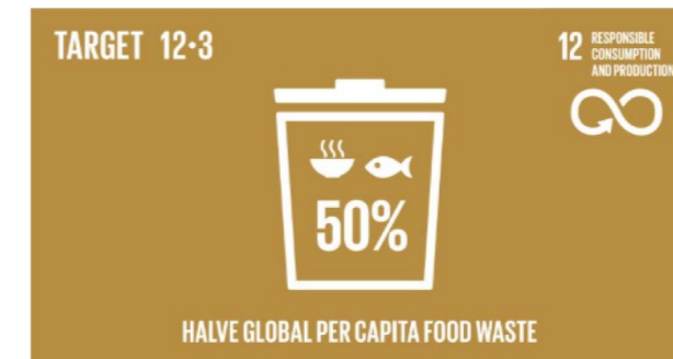
Şekil 1. BM Sürdürülebilir Kalkınma Amaçlarından “Sorumlu Üretim ve Tüketim”

Ek olarak her yıl 29 Eylül’de dünya genelinde Uluslararası Gıda Kaybı ve İsrafı Farkındalık Günü ve bu kapsamdaki etkinliklerde, basın iletişimde bu konu dünya genelinde önemine dikkat çekilmektedir.