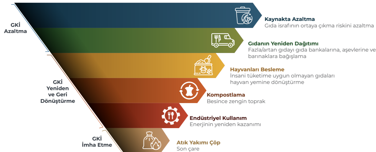
Şekil 7. Gıda Kullanım Hiyerarşisi