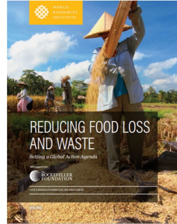
Şekil 2. Gıda Kaybını ve İsrafını Azaltma: Küresel Eylem Planı Belirleme